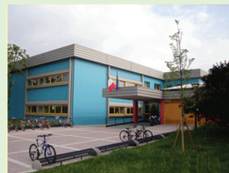
Plesso del Villaggio degli Sposi