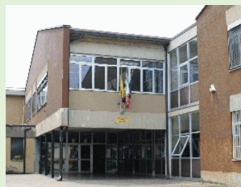
Plesso di Colognola